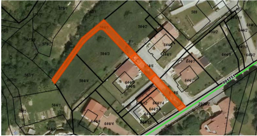
Parc. št. 584/1 in parc št. 644/6 k.o.2381 Lokavec