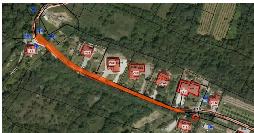
Parc. št. 1245/1 k.o. 2389 Skrilje