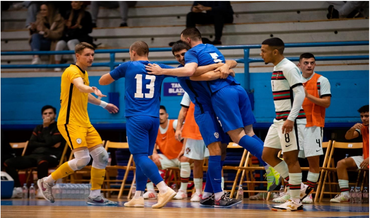
Slika 2: Futsal U21 reprezentanca Slovenija : Portugalska