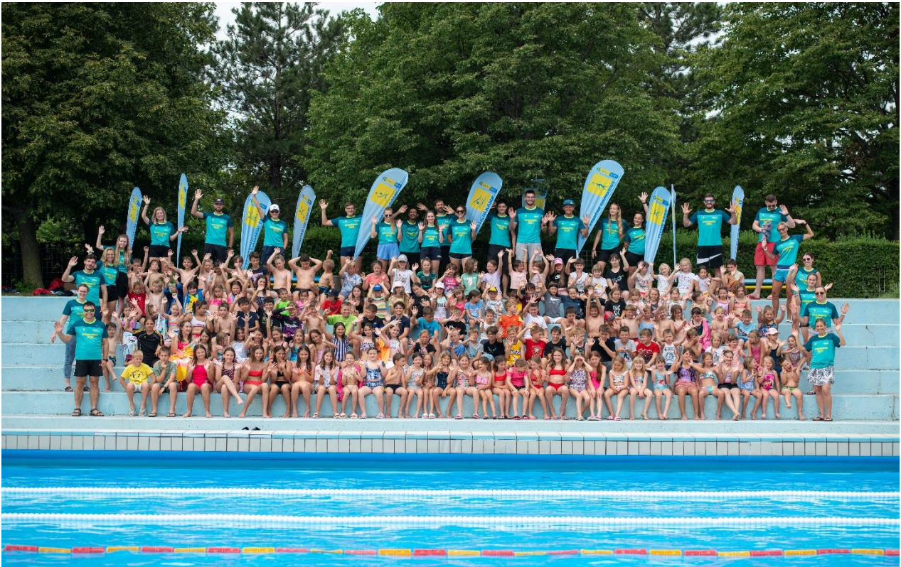
Slika 4: Športne počitnice 2023