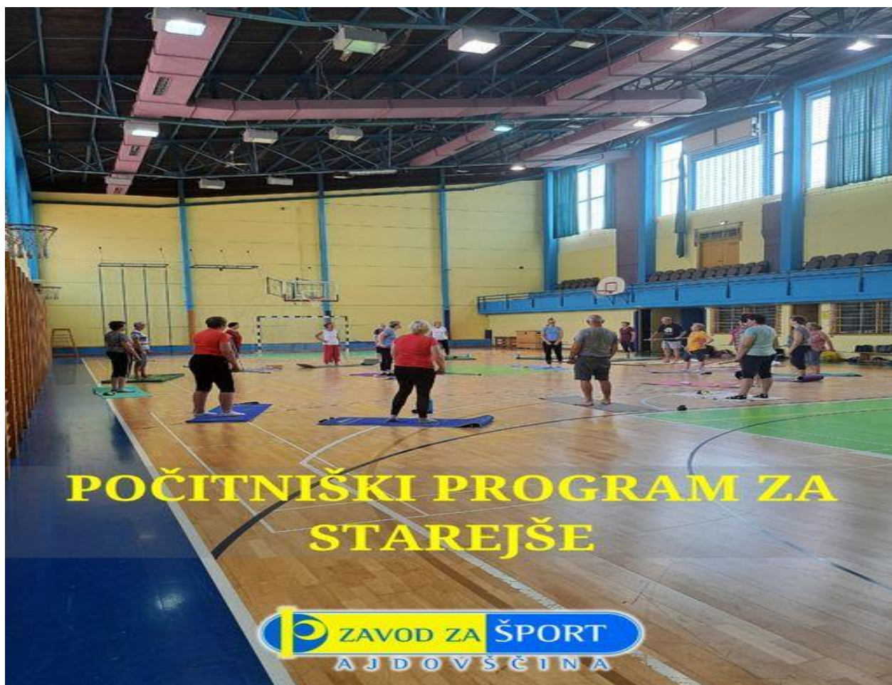
Slika 1: Športne počitnice za starejše