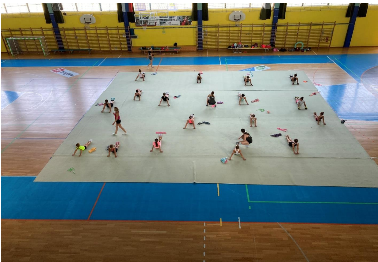
Slika 3: Športne priprave ritmična gimnastika

Tudi v letu 2023 beležimo rekordno število uporabnikov v fitnessu, saj se je število uporabnikov povečalo za 20 odstotkov.