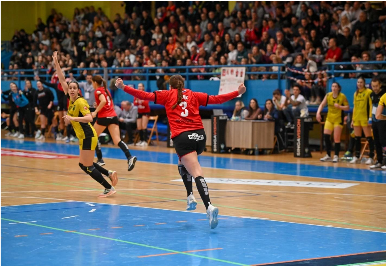
Slika 5: Ženska rokometna tekma evropski pokal 2023