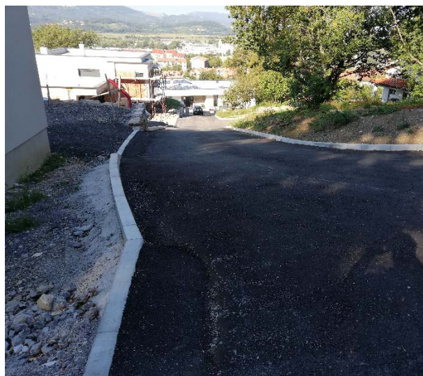
Stanje na terenu z dne 21.8.2020

21. člen ZDOIONU določa, da se vzpostavitev uličnega sistema z imenom ulice ter spremembe uličnega sistema izvedejo z odlokom občine.