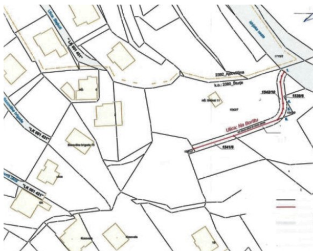
Ulica na Borštu - izsek iz Grafičnega prikaza poteka ulic na območju naselja; Dezis d.o.o. z dne 13.7.2020

Lastniki predlagajo, da se vzpostavi nova ulica z imenom NA BORŠTU, z utemeljitvijo, da je predlagano ime skladno z lokalnim poimenovanjem. Krajevna skupnost Ajdovščina je pobudo obravnavala in s predlogom soglaša.