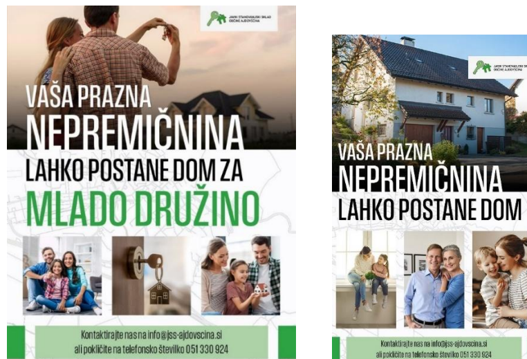
Slika 4: Oglas Vaša nepremičnina lahko postane ddom

Realizacija ciljev: Cilj še ni realiziran.