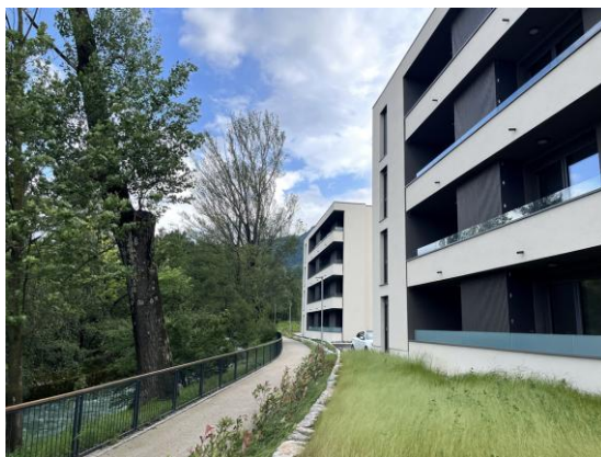
Slika 3 Vila blok ob Hublju

Pogodbe za nakup stanovanj so bile sklenjene 30. 5. 2022, plačilo kupnine za vsa 4 stanovanja je bilo izvršeno dne 29. 7. 2024. Za vsa stanovanja je JSS OA že vknjižen kot lastnik v Zemljiški knjigi. Poleg stroškov nakupa stanovanj je projekt obsegal še stroške izdelave investicijske dokumentacije (DIIP in IP) v vrednosti 5.400,00 EUR brez DDV. Celotna vrednost projekta je znašala 1.077.149,76 brez DDV. Z realizacijo naložbe smo uresničili vse zastavljene cilje projekta.