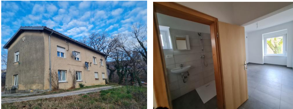
Slika 1 in 2 : Lokavec 74 – prenova in nakup stanovanja

Dne 11. 4. 2024 je bil izveden nakup 1 starejšega stanovanja v Lokavcu . V sklopu akcije Aktivacija praznih nepremičnin smo prejeli ponudbo lastnika stanovanja za odkup stanovanja Lokavec 74, ID 2381-161 (ID 5390192), del stavbe 3, k.o. 2381 Lokavec, na parc. št. *79, opravili cenitev nepremičnine in izvršili nakazilo kupnine v skupni vrednosti 84.000,00 €. Stanovanje smo celovito obnovili ob koncu leta in v njem je dobila svoj dom mlada družina iz Šmarij z mladoletnim otrokom.