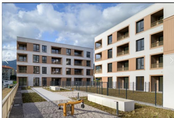
Slika 2 Rezidence Lotus na Ribniku