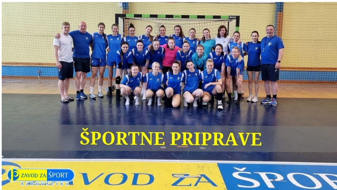
Slika 3: Ženska kadetska rokometna reprezentanca Slovenije 2021