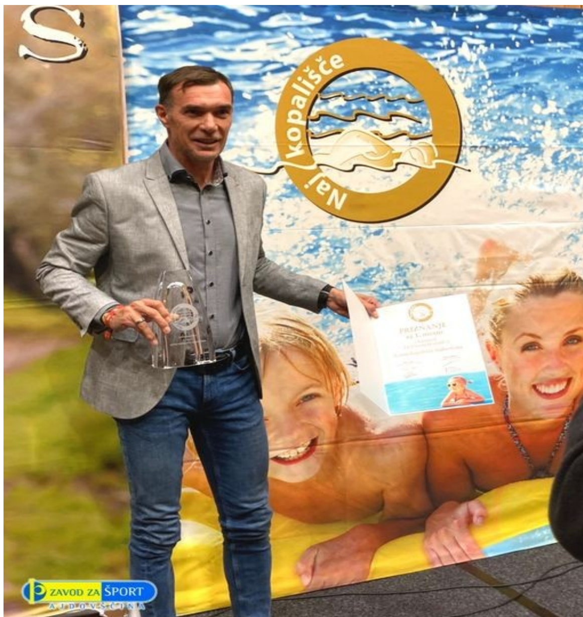
Slika 7: Podelitev priznanja za naj kopališče 2021