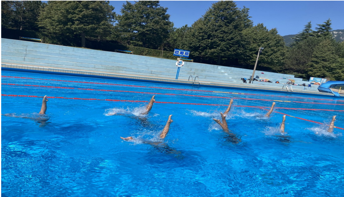
Slika 2: Športne priprave Katalina-Sinhro Ljubljana