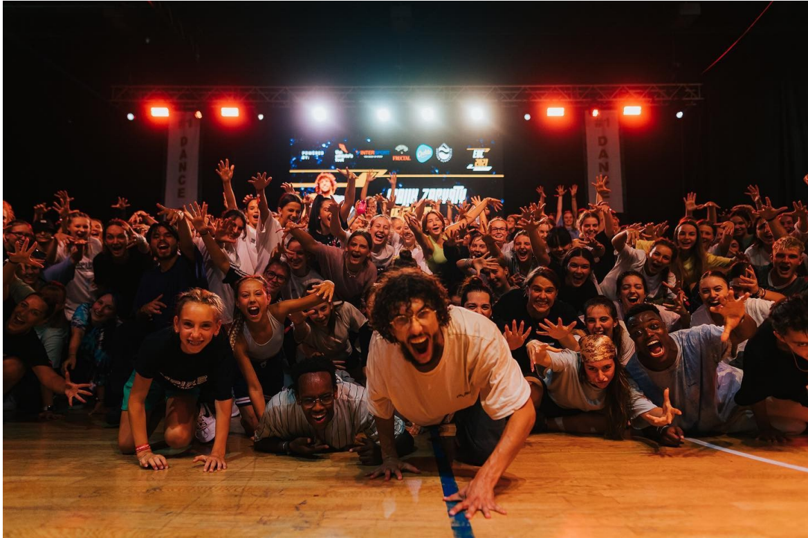
Slika 1: Empire dance 2021