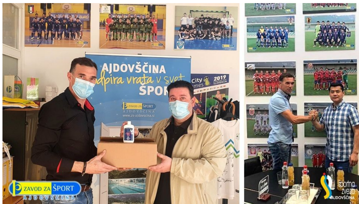
Slika 6: Donacija razkužil