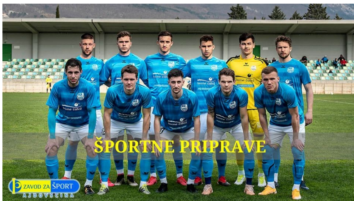
Slika 4: Športne priprave NK Brežice 2021

Povečanje števila uporabnikov v primerjavi z letom 2020 je razvidno iz spodnjih tabel. V letu 2021 so se v objektih Zavoda izvajale prvenstvene tekme ter priprave športnih ekip. Odpovedan je bil maturantski ples, valeta, mednarodne tekme na mestnem stadionu, turnirji športnih društev, zaključek poslovnega leta za podjetja, kulturna predstava, priprave športnih ekip, itd.