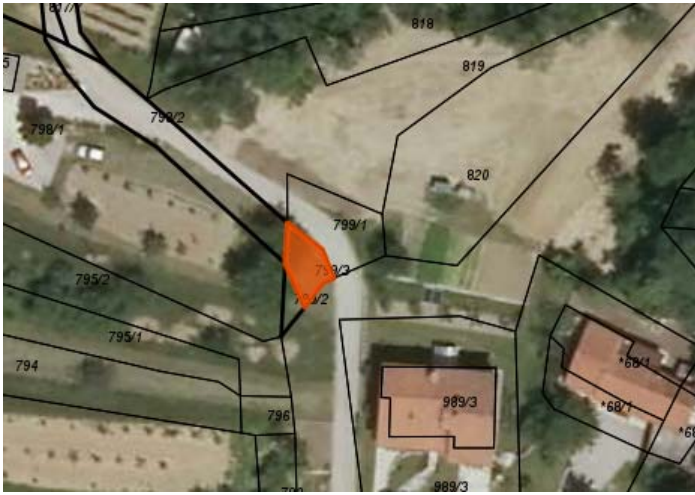
Parc. št. 799/3 k.o. Skrilje