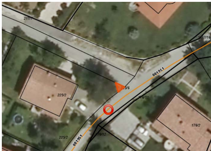
Parc. št. 225/6 k.o. Šturje