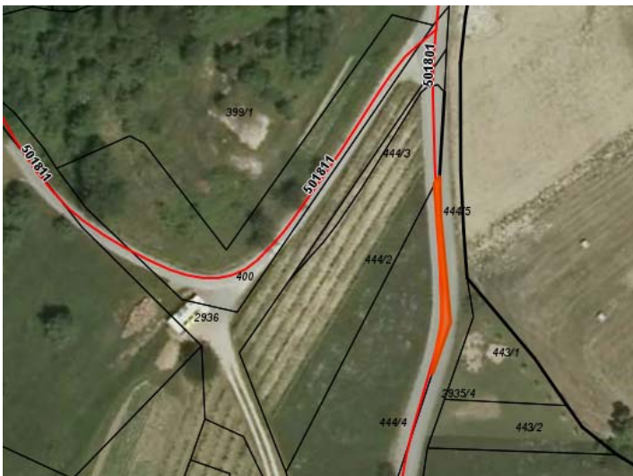
k.o. Lokavec, parc. št 444/5