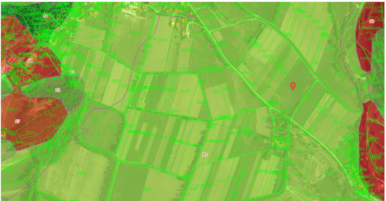
Slika: Bonitetna ocena kmetijskih zemljišč na polju Lokavec.