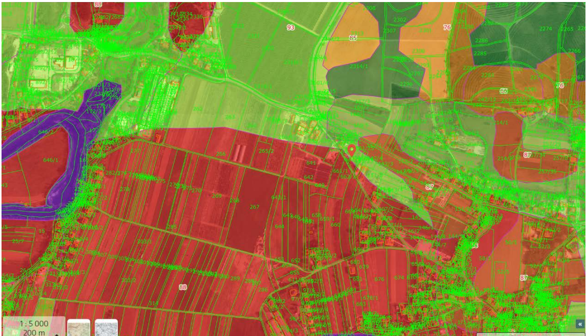
Slika: Bonitetna ocena kmetijskih zemljišč na polju Bilje