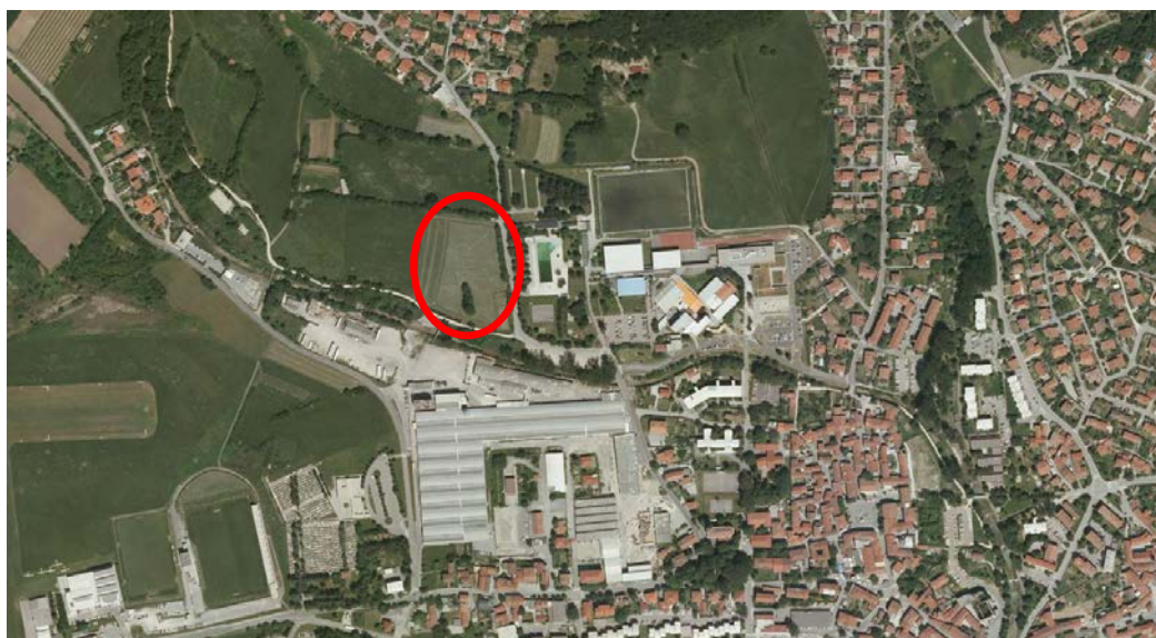
Slika: Območje predvidenega OPPN

Obravnava območje obsega parcele št. 239, 240, 241, 242, 243/3, 1726 in 1727, vse k.o. 2392 Ajdovščina, in meri cca 1,31 ha. Na severu je omejeno z zelenimi površinami mesta in individualno stanovanjsko pozidavo Gradišče, na vzhodu z občinsko cesto in športno rekreacijskimi površinami (bazen in kamp), na jugu z občinsko cesto in vodotokom Lokavšček ter na zahodu z zelenimi površinami mesta.