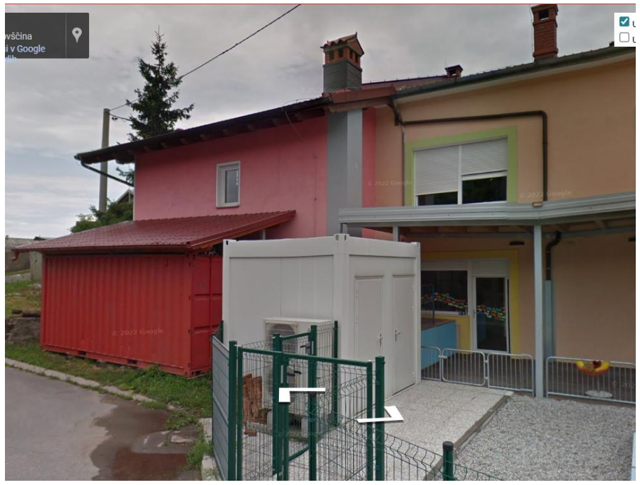
Odda se površina-zelenica, na kateri je zabojnik.