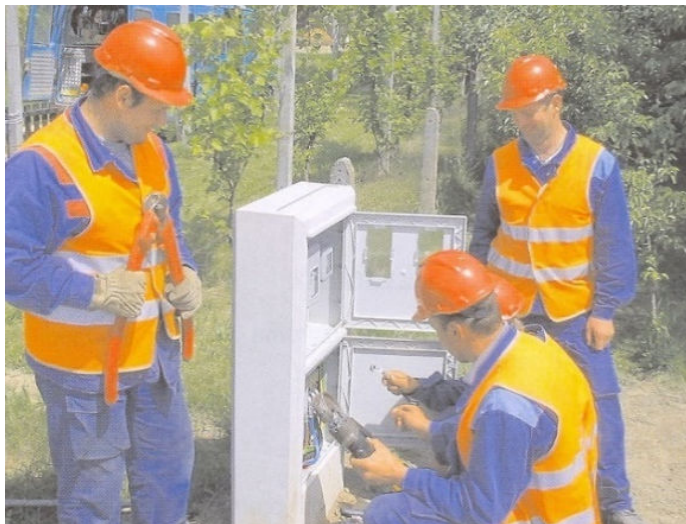
Slika 1: Signalizacijska oblačila z odsevnimi trakovi

Delavci, ki izvajajo kakršnakoli dela ob potekajočem prometu, morajo nositi signalizacijska oblačila z odsevnimi trakovi, izdelana v skladu s standardom EN ISO 20471:2013.