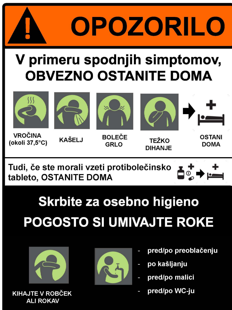
Slika 4: Simptomi in higiena